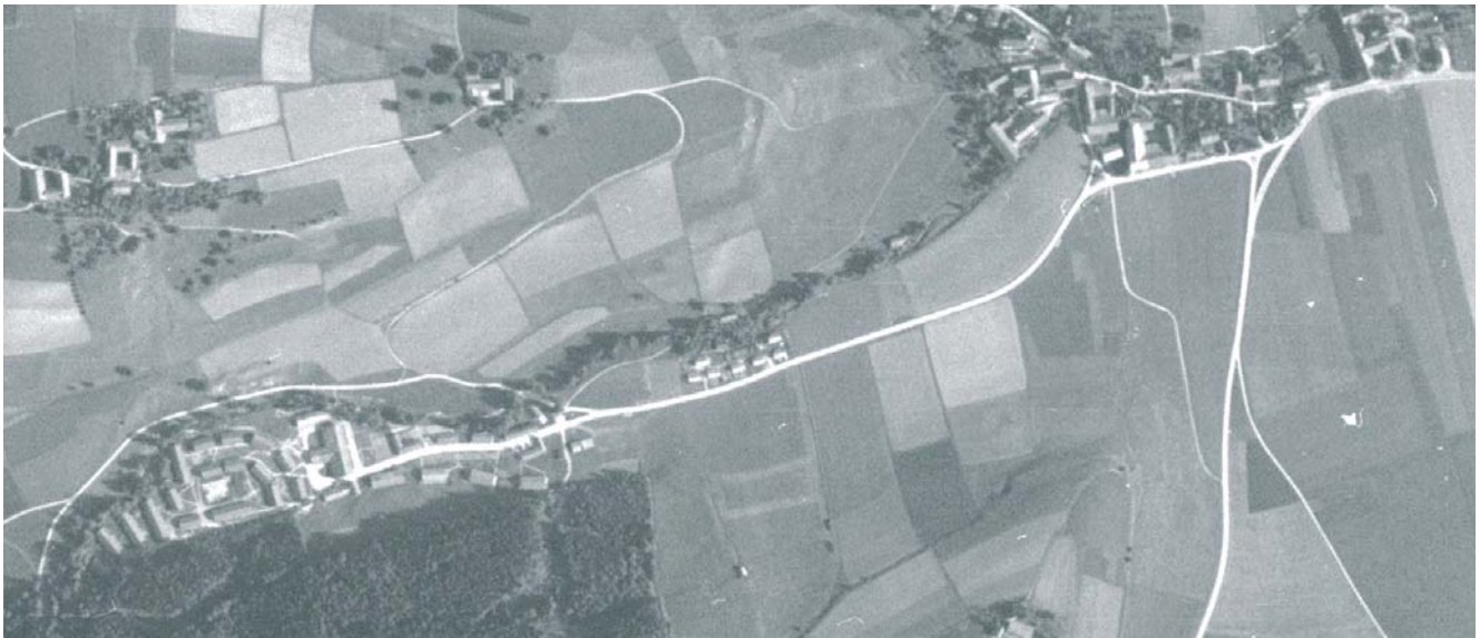
Luftaufnahme Berufsbildungswerk und Siedlung Waldwinkel von 1945

Die Chronik wird ca. 130 Seiten umfassen und sich an die, in der Gemeinde aufliegende Chronik über die Werkanlage Aschau ( http://aschau-a-inn.de/cms/wp-content/uploads/2015/08/Chronik-Aschau-Werk.pdf ) anlehnen.