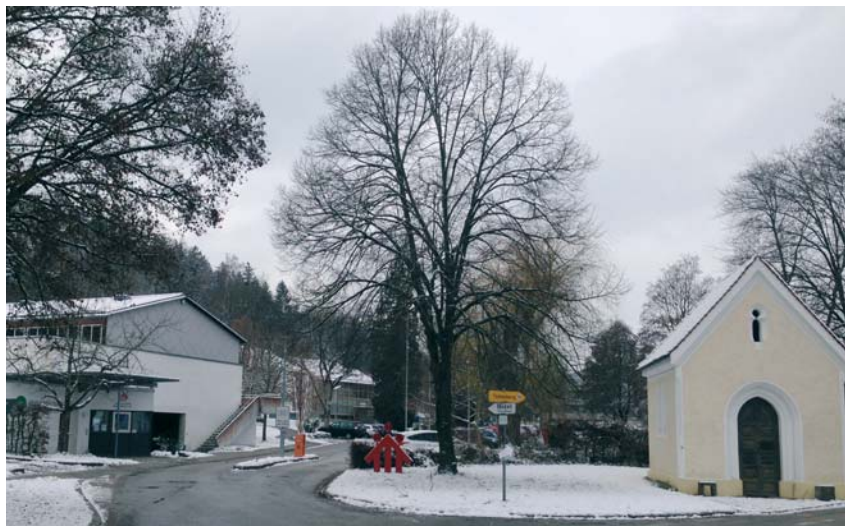
Eingang zum Berufsbildungswerk 2019

Bedeutende geschichtliche Hinweise (ab 1937/38) aus der Bevölkerung werden gerne zur Veröffentlichung in der Gemeinde entgegengenommen.